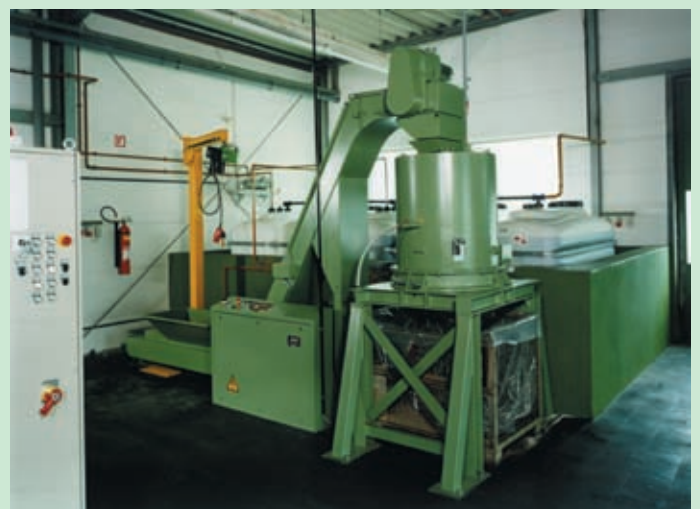
Tratamiento de virutas con preparación del aceite.