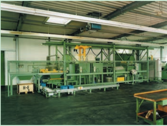
Instalación automática de lavado: separación del aceite, separación de virutas, lavado, aclarado, secado, descarga en cajas transportadas por vías de rodillos.