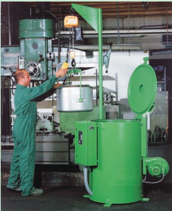
Centrifugadora de alimentación manual para diferentes aplicaciones.