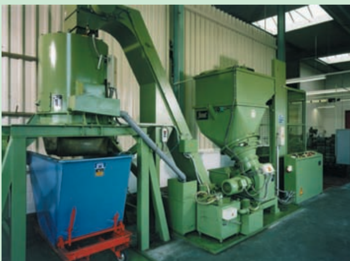
Instalación de tratam. de virutas de reducidas dimens. con molino de virutas.