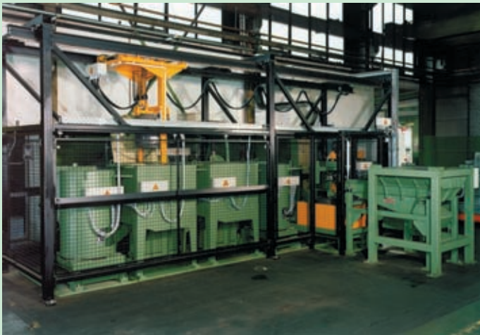
Dispositivo de lavado automático con alimentación del material a través de un canal de carga.