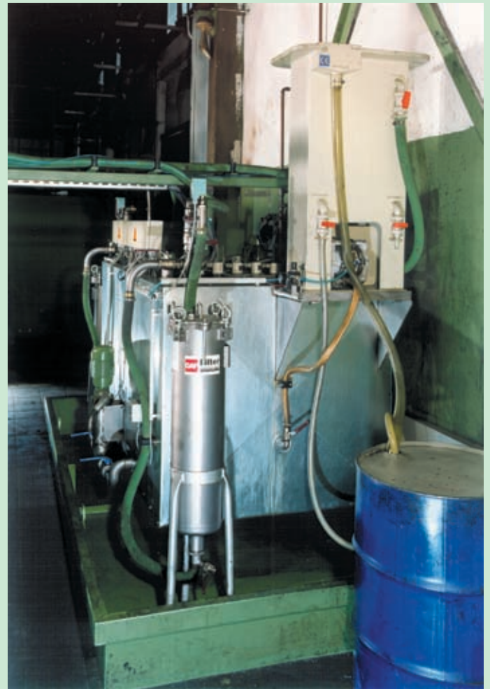
Preparación del detergente: separador de aceite y filtro