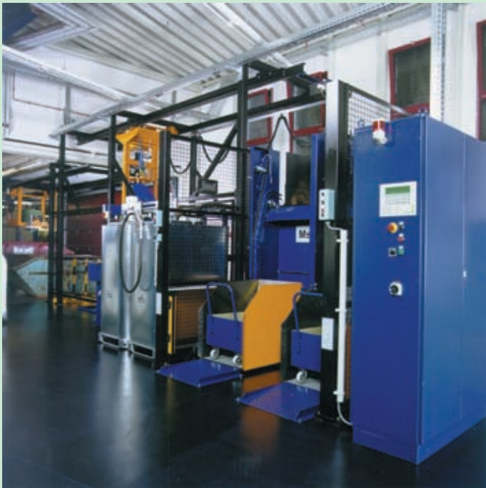
Tratamiento de las virutas y recuperación de diferentes tipos de refrigerante (aceite/emulsión)