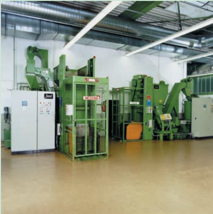
Dos líneas de tratamiento de virutas con molino de virutas para diferentes refrigerantes.