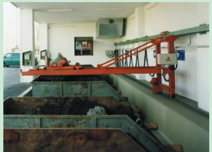
Llenado de contenedores separados según el tipo de material.