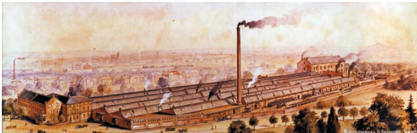
Cuadro histórico de las instalaciones de la empresa alrededor del año 1908.