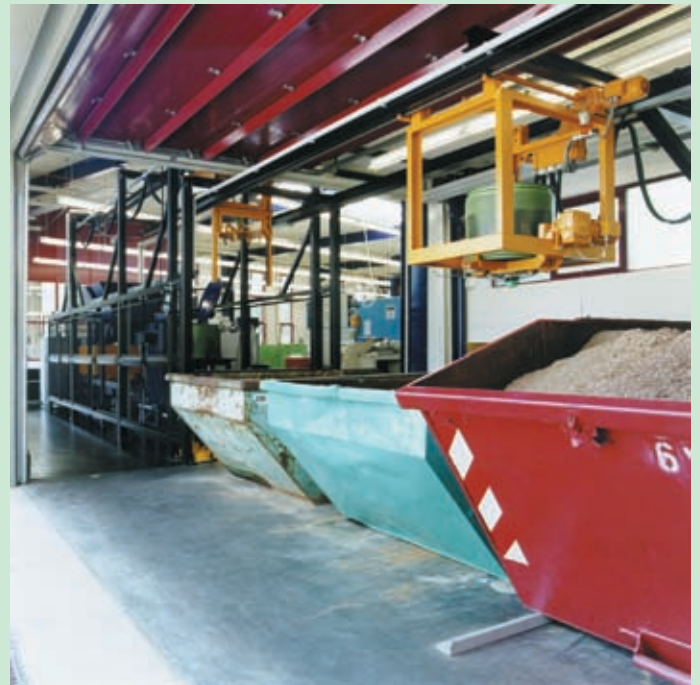
Distribución de virutas de diferentes materiales en contenedores.