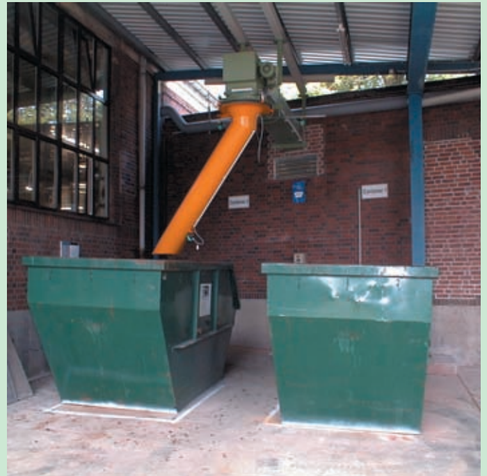
Tubo giratorio para el llenado automático de contenedores dirigido a través de una sonda de nivel.